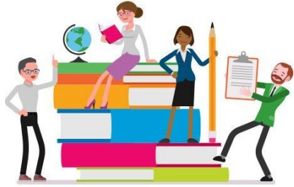
Professores da Turma X Padrinhos da Turma X