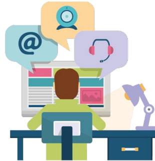
Mediador Virtual da Turma X