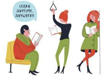
Estudantes da Turma X Líderes de Sala