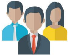
Equipe de Apoio ao Ensino